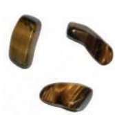
(Œil de tigre Brutes)

D'autres préféreront travailler avec une pierre taillée, polie, voire roulée, qui, de par leur forme tendre, arrondie et lisse, sont utiles pour divers massages, mais sont également remarquables pour leur brillance et leur beauté.