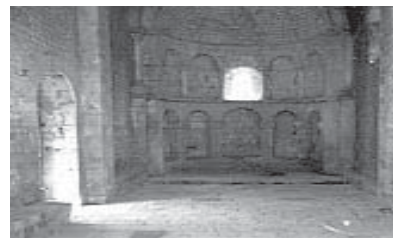
Abside voûtée en Cul-de-four