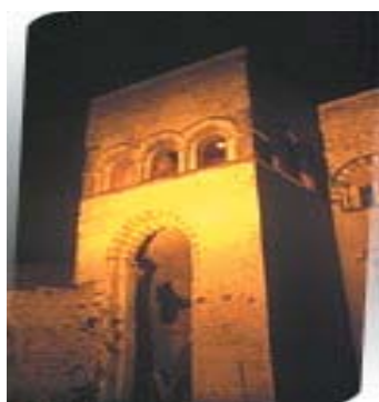
Château de Montélimar