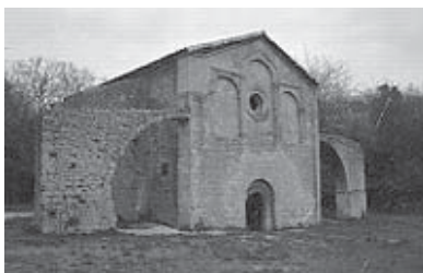
Chapelle Romane du 12 e siècle

Mais la beauté du lieu, c'est aussi l'énergie qui en dégage, une énergie puissante mais douce, peut être est-ce dû au multiples bassins qui entourent presque le terrain.